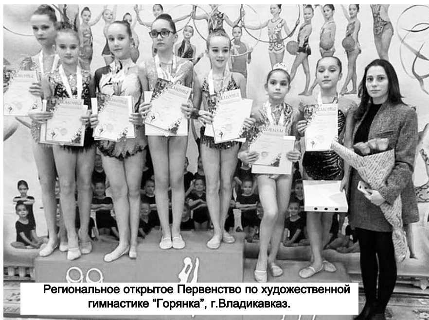
Региональное открытое Первенство по художественной гимнастике "Горянка", г.Владикавказ.

В 1999 году Федерация спортивной и художественной гимнастики России выступила с инициативой учреждения Дня тренера. А в 2017 году в Ардоне, на радость многим мамам и их девочкам, состоялось открытие секции художественной гимнастики в школе №4. На тот